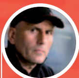
Elie Baup "Un véritable outil pour les éducateurs"