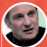
Jacques Crevoisier "Un magazine en tout point remarquable"