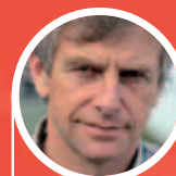
Christian Gourcuff "Je me félicite qu'une telle revue ait vu le jour"